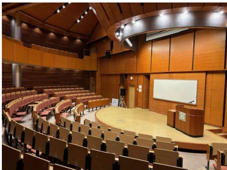
（カルチャーホール）