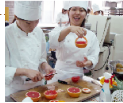
「グレープフルーツのバスケット」

一番難しかったのは、グレープフルーツのバスケットとリングで船を作ることでした。ナイフが上手く入らず何度も失敗しましたが、先生からのアドバイスで綺麗に仕上げることができました。一人ひとりにアドバイスをいただき、とても勉強になったようです。これからケーキのデコレーションにも活かしていきたいと思えます。