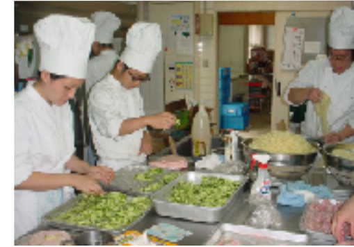
「3日目の冷やし中華作りの様子」