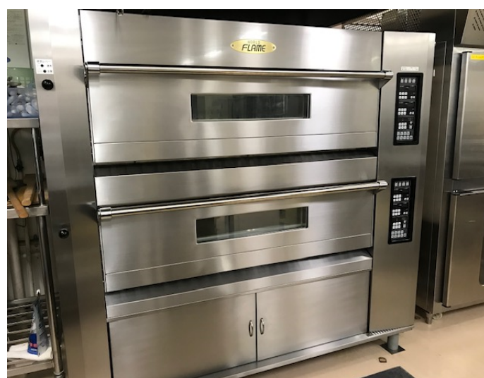
製パン・焼菓子実習用オーブン

教育環境設備等の充実化を目的として、食物科では、製菓実習室の「製パン・焼き菓子実習用オーブン」と「カフェ学実習用エスプレッソマシーン」を新設しました。