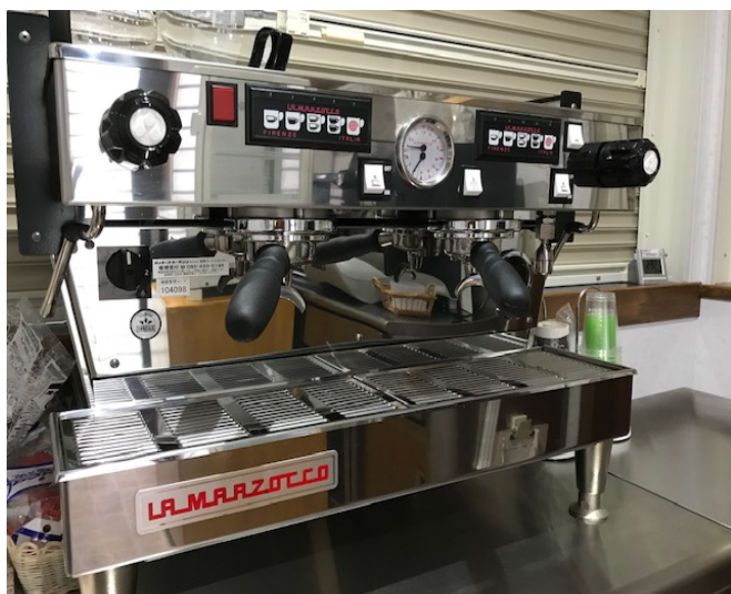
カフェ学実習用エスプレッソマシーン